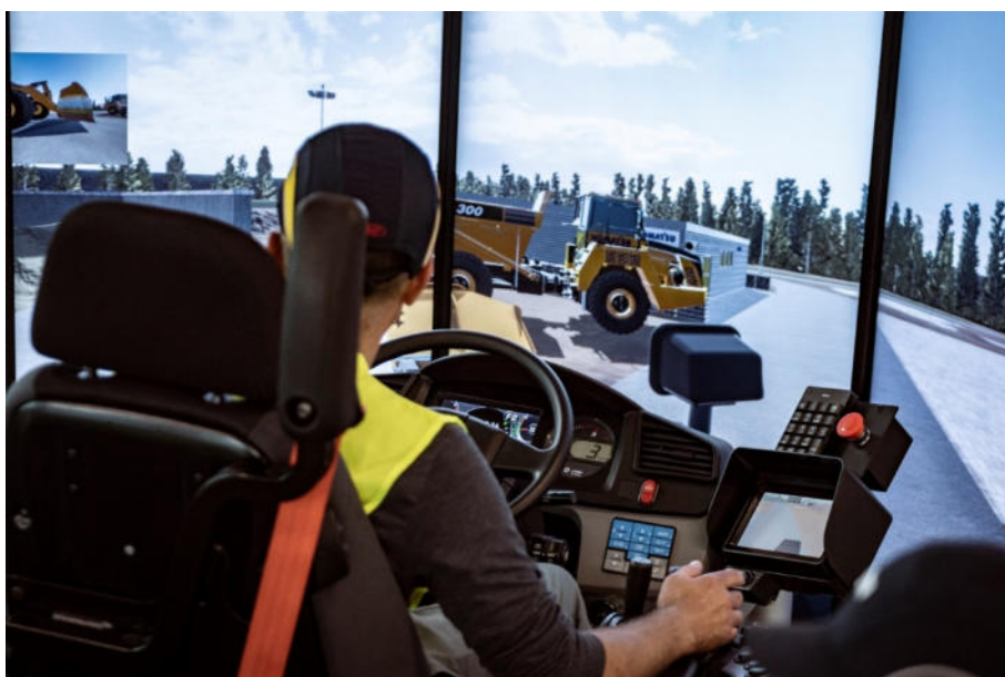
Ein Schulungsteilnehmer testet sein Können am Komatsu Fahrsimulator unter realistischen Einsatzbedingungen.

Die jeweils mehrtägigen Schulungen finden in Kleingruppen und mit verschiedenen Komatsu Maschinen statt. Für Verpflegung ist gesorgt, auf Wunsch und je nach den Möglichkeiten der aktuell geltenden Beschränkungen durch die COVID-19 Pandemie, gibt es ein Rahmenprogramm.